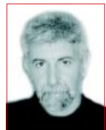
Por Walter G. Belfiore, IT CAME

Si no fuera posible bajar el número de impresoras por las razones que fueren, hay varias empresas que colocan los equipos sin cargo cobrando sólo por los insumos y mediante un abono mensual. El servicio incluye en el precio el mantenimiento de esas impresoras como así también el recambio sin costo, modalidad que nos permite mantener siempre actualizado el parque de impresoras.